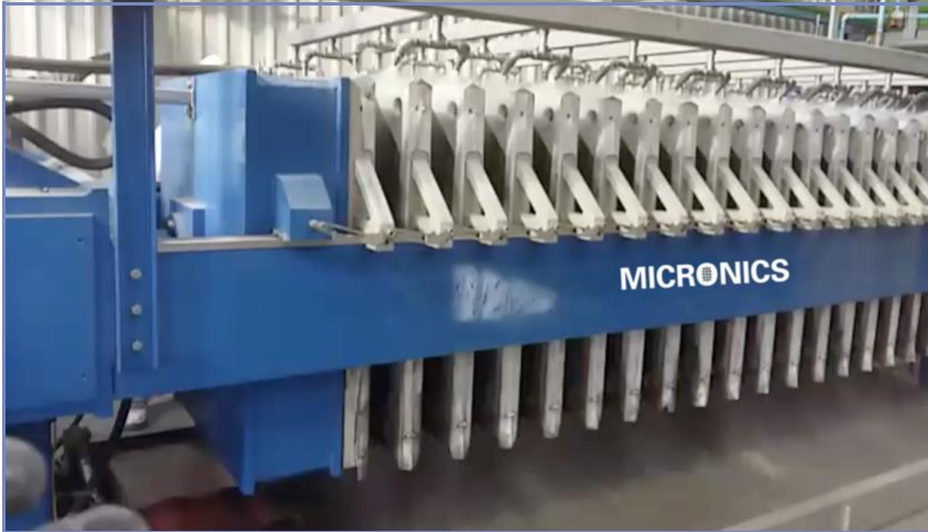
Placas De Filtro Vinculadas