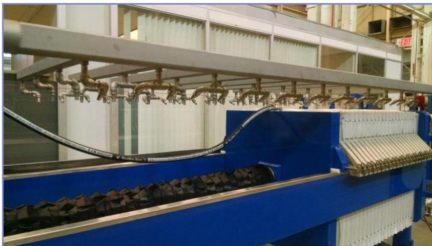
Cabezal De Inundacion De Lavado De Tela