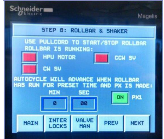
Pantallas Personalizadas De Interfaz Hombre-Máquina (HMI)